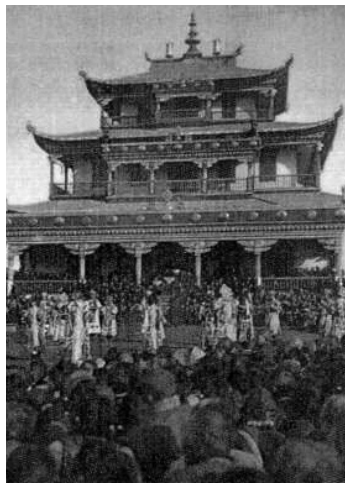
ТАМЧИНСКИЙ ДАЦАН НАЦАРХИВ БУРЯТИИ